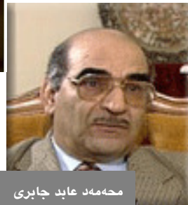
محمەد عابد جابرى

ئارگۆن: بروام واىە جابرى بەشدارى لە بزوتنەوھى بەرخۆرى (استھلاك) ئايدۆلۆژى كەلەپوردا كرد. بەمانايەكى تر ھەولنى دەدا ھەندىك خەسەتى سەردەمى كلاسىك دەرخات (سەردەمى زىرپىنى شارستانىيەتى عەرەبى_ئىسلامى) عەرەبى ئەمپۆ رازىبكات بەوھى رابردووئەكى پىرشنگداريان ھەيەو دەتوانن پىشتى پىببەستت بۆ ئەوھى پووبەپووى مۆدىرنىيەتى ئەوروپى پى بىنەو. بەلام گرتتەكە لىرەدايە، كە چارەسەر لەبەر خۆرى ئايدۆلۆژىيە كەلەپوردا نىيە، يان لەشانازىكرىن بەباب و باپىرانەو نىيە، بەلكو لەوھادايە ئەم كەلەپورە وەكو خالى دەرچوون بۆ گەيشتنى بە پەورەوھى شارستانىيەتى ھاوچەرخ دابنرىت