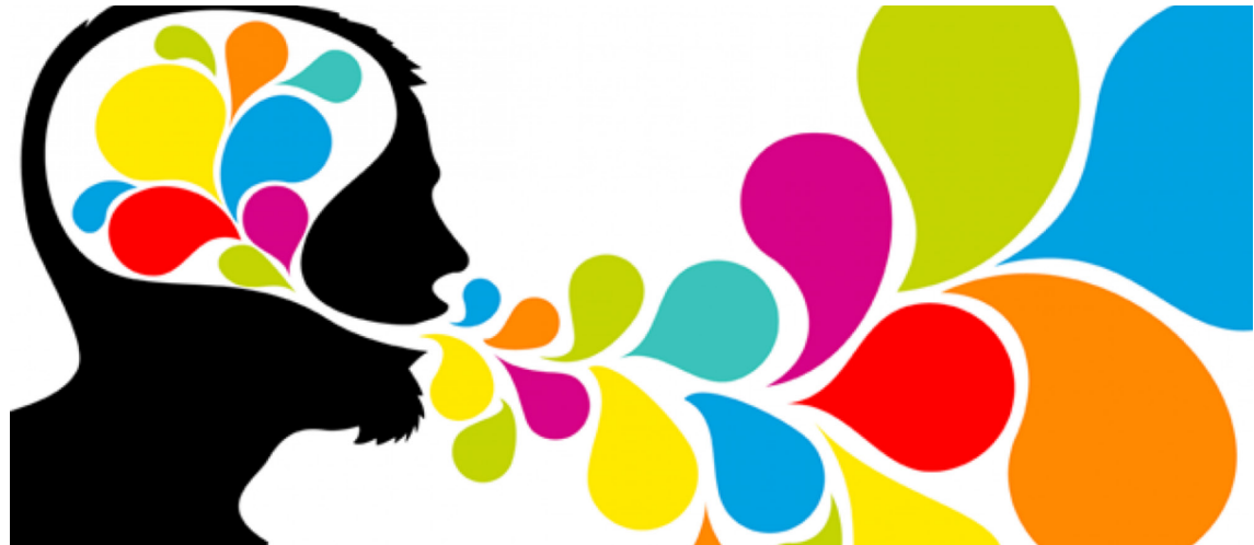
فېربوونى زمان لە رېگەى شوک و سودفەۋە بەرەۋ بەزانستىكرىد

ناۋەستى پىموايە لە تاقىگەى خۇيان بۆ سەركەۋتى كارەكەيان كىرپىتتان، بەلام رايانگەيەنن. زاناکان زۆر شتىان ھەيە، بەلام بلويناكەنەۋە بلپن ئەو كارەمان كىردوۋە، زاناکان لە تاقىگەكانى خۇيان شتەكەن بۆيە زانست ناۋەستىت، ھىچ كەسىكىش ناتوانىت پىش لە زانست بگرىت، ئەو زانايەى يەكەمجار (DNA) دۆزىيەۋە رووى لە مرؤفياى كىرد و وقى لەمەدودا ھەر كارپىكمان كىرد نەلپن ناتوانن بىكەن، زۆرچار وتمان ئەو كارە دەكەين وتمان ناتوانن، بەلام دواچار كىردمان. ئەوان بىانەۋىت ۋەكو زانست دەتوانن مرؤف كۆپىكەن، چونكە ئەندامەكانى لەشى مرؤف كۆپىكراۋە. بۆ ھوونە: زانايەك ھەيە دەلپت دەتوانن مرؤف دروستبەكەين، بەلام سەرى نەبىت بۆئەۋەى دەستى ۋەكو يەدەگ بىت بۆ كەسىك بەكاربھپىزىتەۋە، كە دەستى