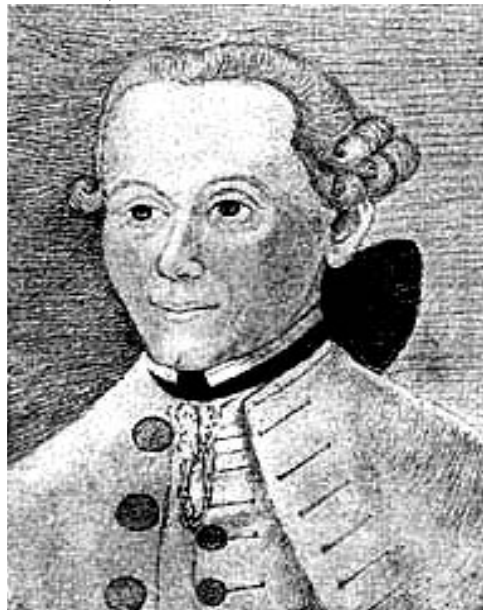
سيستما تيكييه "سه رچاوه ي پيشو، ژماره 27).

به كار به يرين، به وي نه ي زرن گانه وه ي گه مه كان ي وشه جيره جيره نه زرن گينه وه! ئه و ناوانه ي كه له زماني ئەلماني دا بو پوست و پله و پايه كان ي له نمونه ي ئه مانه دان دراون: Botschafter (بالويز و) Feldherr (ليوا)، سه روكي گشتي). هتد دهنگي زرن گانه وه يان له گويدا خو شتره زماني ئەلماني زمانيكی وردتره، زمانيكی تيروته سه ل و دهوله مندتر، له باره ي وينا ئه قلبييه كانيشه وه كه بو مه سه له ئه زمونيه كان پيوستن، فره گوزارشت و دهر برينه، زمانيكی