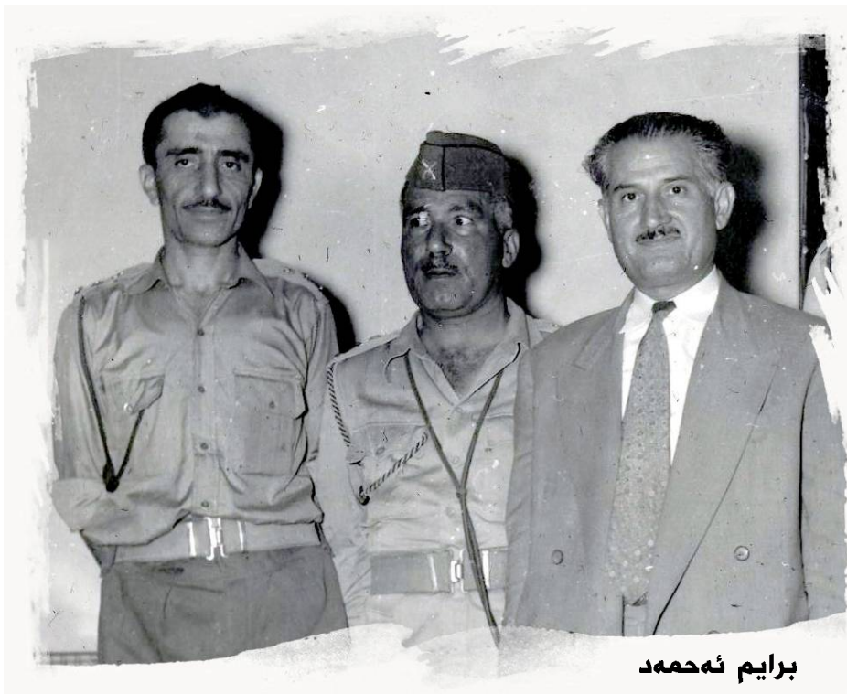
برایم ټه حمه د

یه کسان که ی له گه ل رووی زه مین ناتوانی وا که ی کورد نه بین هه ر کورد بووین و هه ر کورد ده بین له پیش ناگر په رستی دا له پیش موسولمانیت ی دا له دیلی و له سه ر په رستی دا هه ر کورد بووین، هه ر کورد ده بین... ل 68 شاعیر وه ک شاعیرانی تر، دووباره وه رزی نازاره کان به دریزایی میژوو، وه ک نمونه ده هیښتته وه و ده یه ویت بلیت له پیناو خاک و نه ته وه و نیشتماندا، چه ندین نازار و قوربانیمان داوه و لپی په شیمان نین و له سه ری به رده وام ده بین، ټه مهش وه ک قهرزکی نه ته وه یی و نیشتمانیه و ده یه پنه وه، وه ک ده لیت: ديسان نازاره، ديسان نازاره