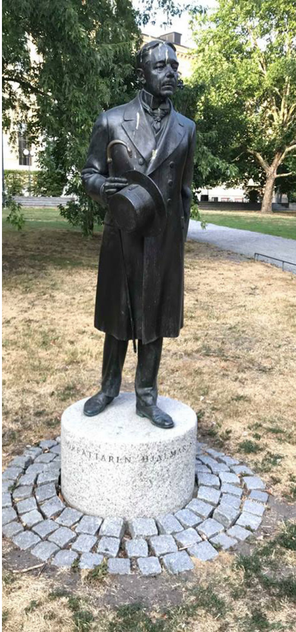
پەيكەرى: يالمار سوئدەربېرى

ئەم شارە بەرپەشتەرتىن شارى جىھانە. گەر جارېك لە جاران، شاعىرىك يان ھونەرماندىك لە كارە ھونەرىيەكەيدا ئەو سنوورەي بۆي دانراوۋە بەزىيىت و ھەرۋەھا بەھرەكەي خۆي بە خراپى بەكاربھىيىت، ئەو بەتەنھا مۇقەكان نىين، بەلكو تەنانت سەگى بچكۆلە و گەنەلېش زىاد لە رادە تورپە دەكات.