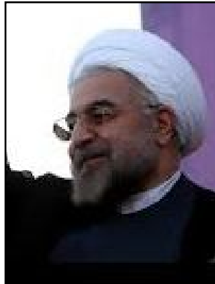
مه مه رده زار عارف