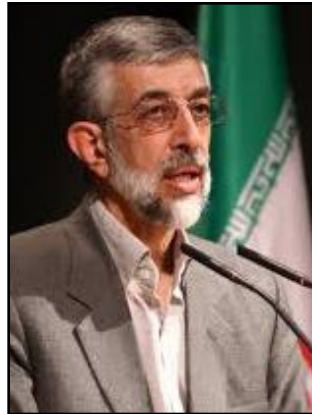
مه مه رده زار عارف