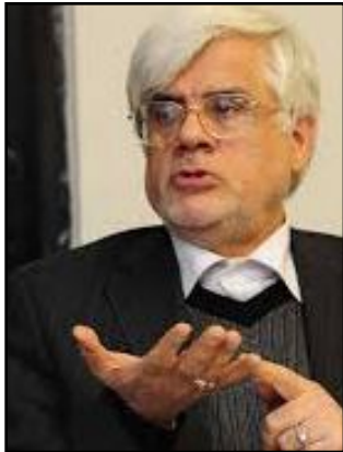
مه مه رده زار عارف