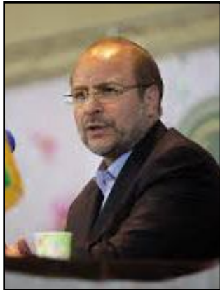
مه مه رده زار عارف