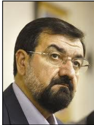
مه مه رده زار عارف