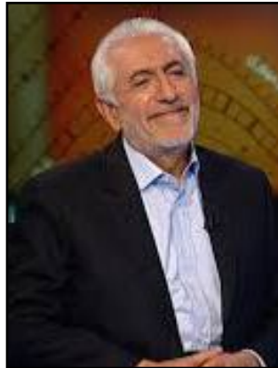
مه مه رده زار عارف