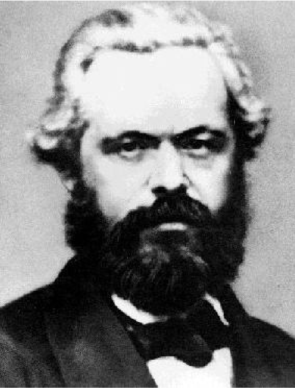
ن: هوشه نگما هرویان له فارسیه وه: هیوانه مانی

لؤکا چیپیو ایه (( میژو ویفه لسه فه ی کلاسیکیه لما نیا با به تیکیز و گرنکه که هیشتا له روانگه بیرو پای مارکسیسته وه به شیوه یه کیگشتی شروقه نه کراوه )) نه مه میژو ویه که به دیهینه ریکانت، شلینگو فیورباخه . فه لسه فه یما رکسد ریژه یلوژیکی ئایدیا لیز میکلاسیکیه لما نیا یه . پلخا نو فیپیو ایه فه لسه فه یکلاسیکی نه لمانیای ((رؤلیکیزؤرگرنگی له به ره و پیشچو و نیزانستله سه ده ی نوزده یه مداگیراوته نانه تله به ره و پیشچو و نیزانستیسر و شتیشدا رؤلکیگرنگیه بو )) فه لسه فه ی ئایدیا لیزمیئه لما نیا یکاریه کی زوریه سه رسپاسه توه خلاقه بو