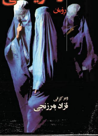
ۋىزىۋى ئازاد بەرزىجى

عەتىق رەھىمى نەفرەت لە دۆستۇيىفسكى رۇمان