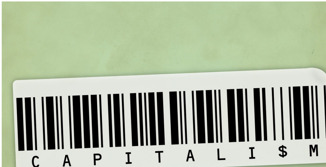
نىوكۆنزەرفاتىشىزم سەرمايەدارىيە لە بەرامبەر شۆرشە كۆمۇنىستىيەكاندا دانا

* لە بەشىكى زۆرى سەدەى بىستەمدا دژايەتى فاشىزم لەگەل دژايەتى بو ئاشتى وەك يەك دادەنران. لەگەل ئەووشدا ئىستا بىنەرى ئەوەين كە