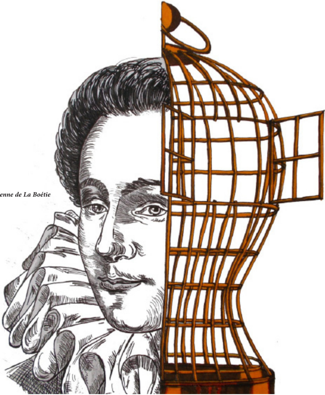
Étienne de La Boétie

-سەرۆه ختیک پروم کرده دهرهوه، ولات به رووی تهواوی دنیا دا کراوه بوو. خه لک و خوا سیاسی بوون و بو پرسه نیشتمانیه کان په رۆش بوون. واته ولات له پیناوی سهر به خویدا تیده کوشا. ئەو قۇناغه تهنه قۇناغیک بوو تیایدا رۆژنامه سەنگ و قورسای هه بوو، به تایهت له شارهکاندا. تا ئەو کاته هیچ مملانی و گیرمه و کیشهیهک نه بوو.