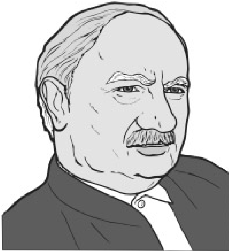
گۆفارىنكى فكريیە، دەزگای والا دوو مانگ جارنك دەرىدەكات